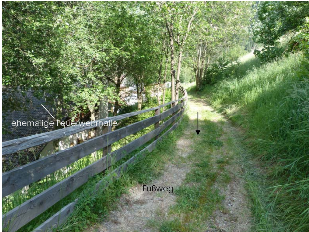
Abb. 1: Übersichtsfoto mit Kernbohrung „S1“ ( ↓ ) mit Blickrichtung Süd-Osten