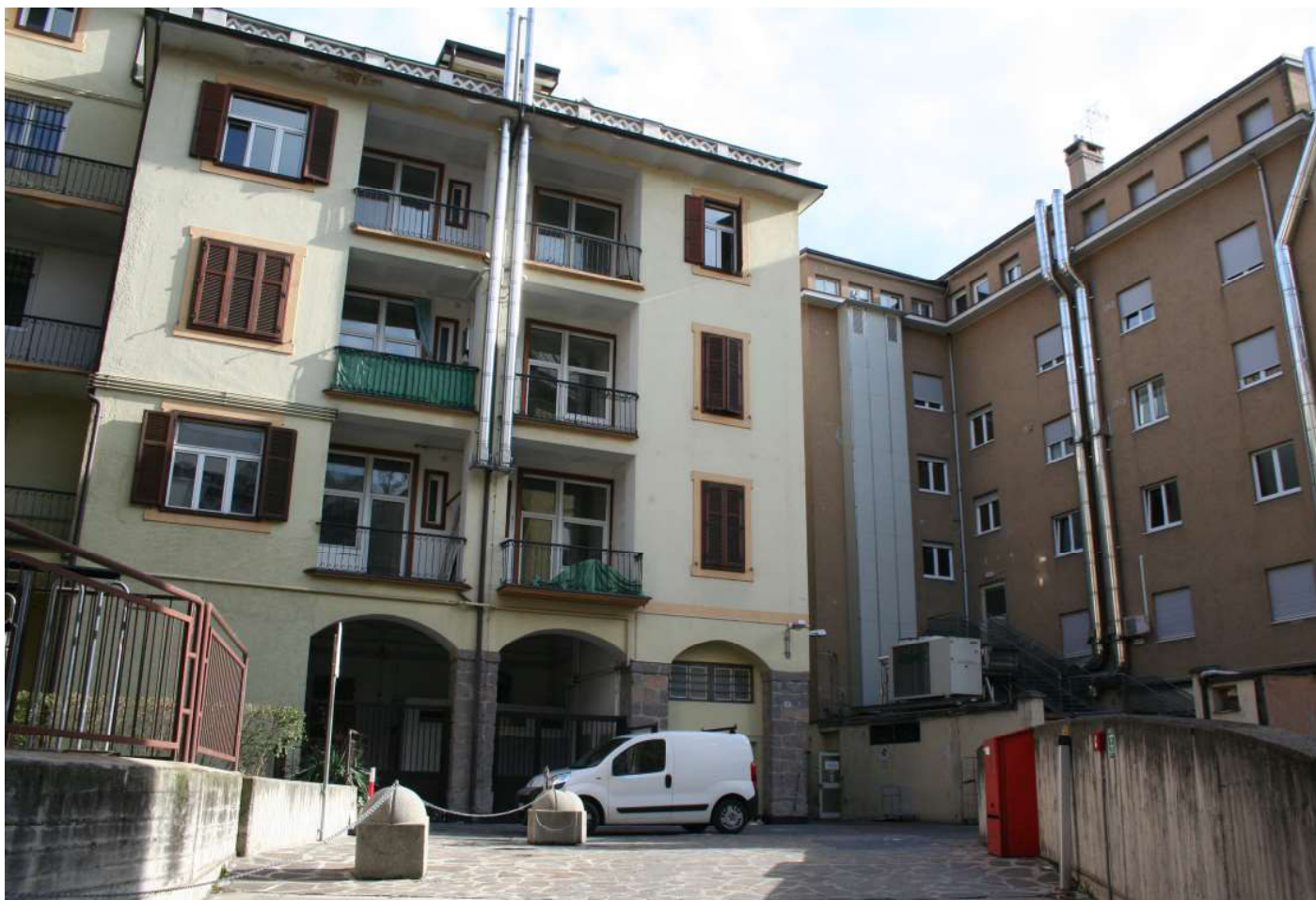
7 - Blick auf den Innenhof, Rückseite des zum Abbruch bestimmten Gebäudes - Vista dal cortile interno, retro edificio oggetto di demolizione