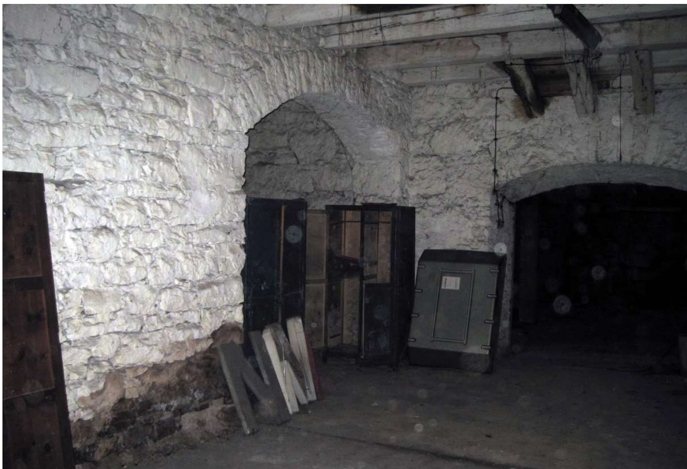
10 - Untergeschoss -2, Kellerraum - Vista interna cantina piano -2