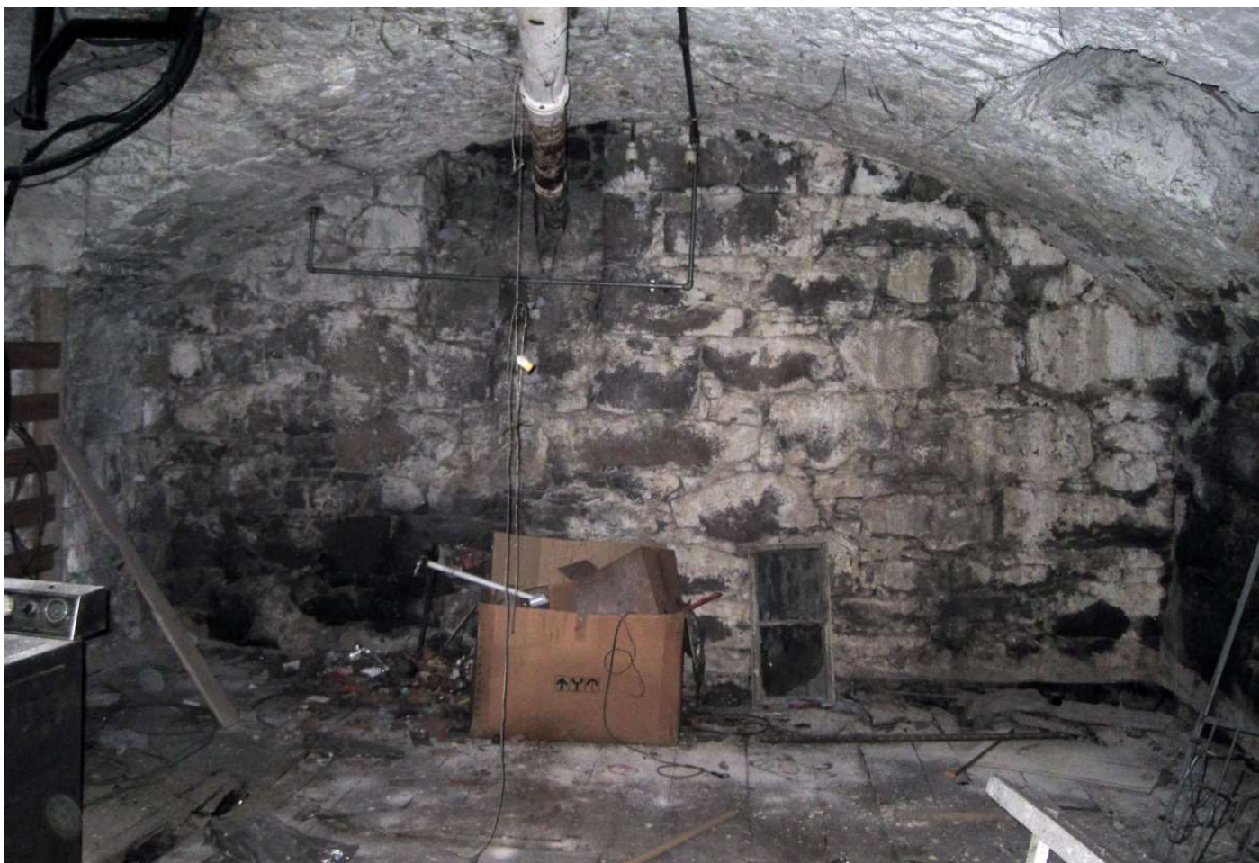
9 - Untergeschoss -1, Kellerraum - Vista interna, cantina piano -1