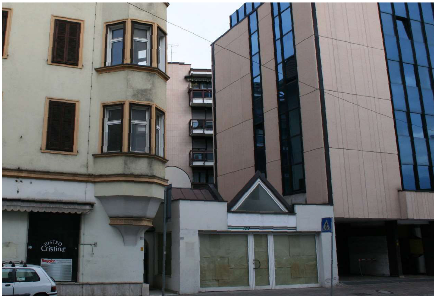
3 - Blick von der Rittner Strasse auf eines der zum Abbruch bestimmten Gebäude - Vista da Via Renon, dettaglio edifici oggetto di demolizione