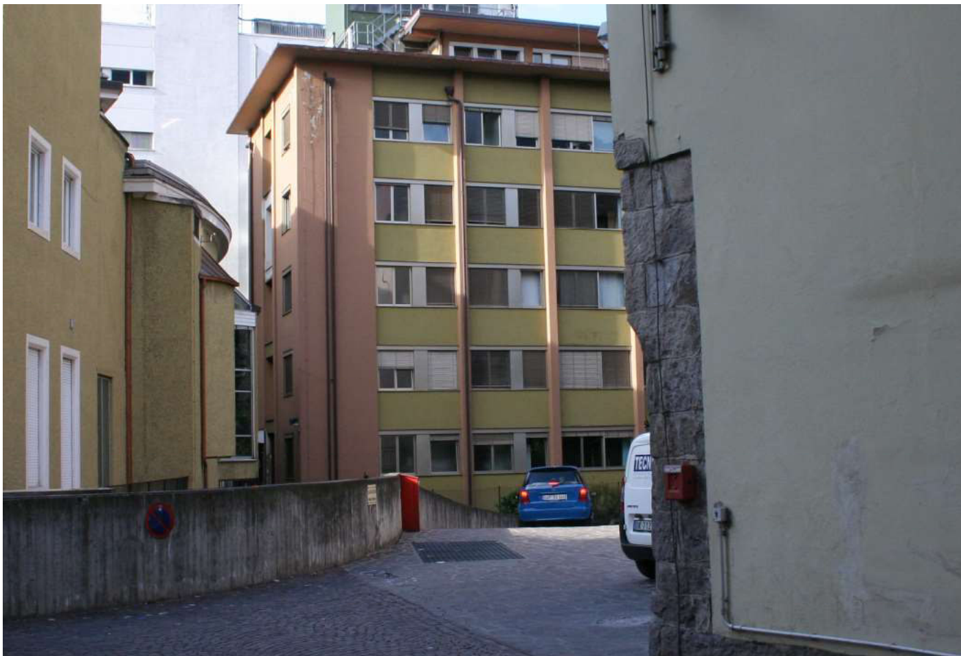
5 - Blick von der Einfahrt - Vista dalla strada privata