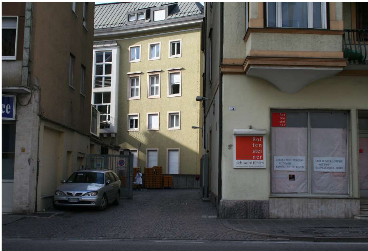
4 - Blick von der Rittner Strasse auf die Grundstückseinfahrt - Vista da Via Renon, dettaglio ingresso strada privata