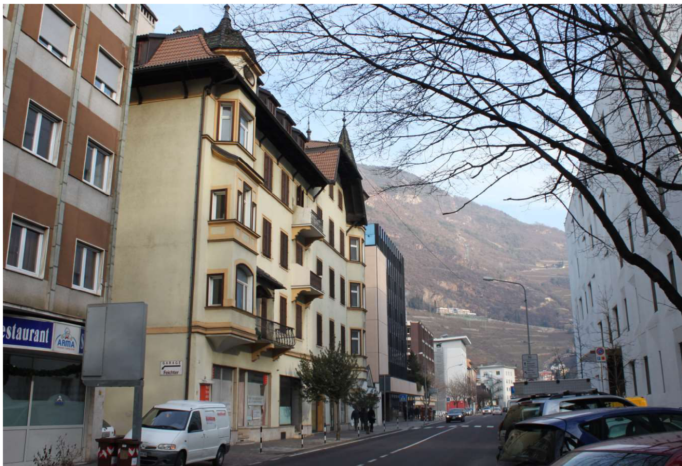
1- Blick von der Rittner Strasse auf die zum Abbruch bestimmten Gebäude - Vista da Via Renon degli edifici oggetto di demolizione