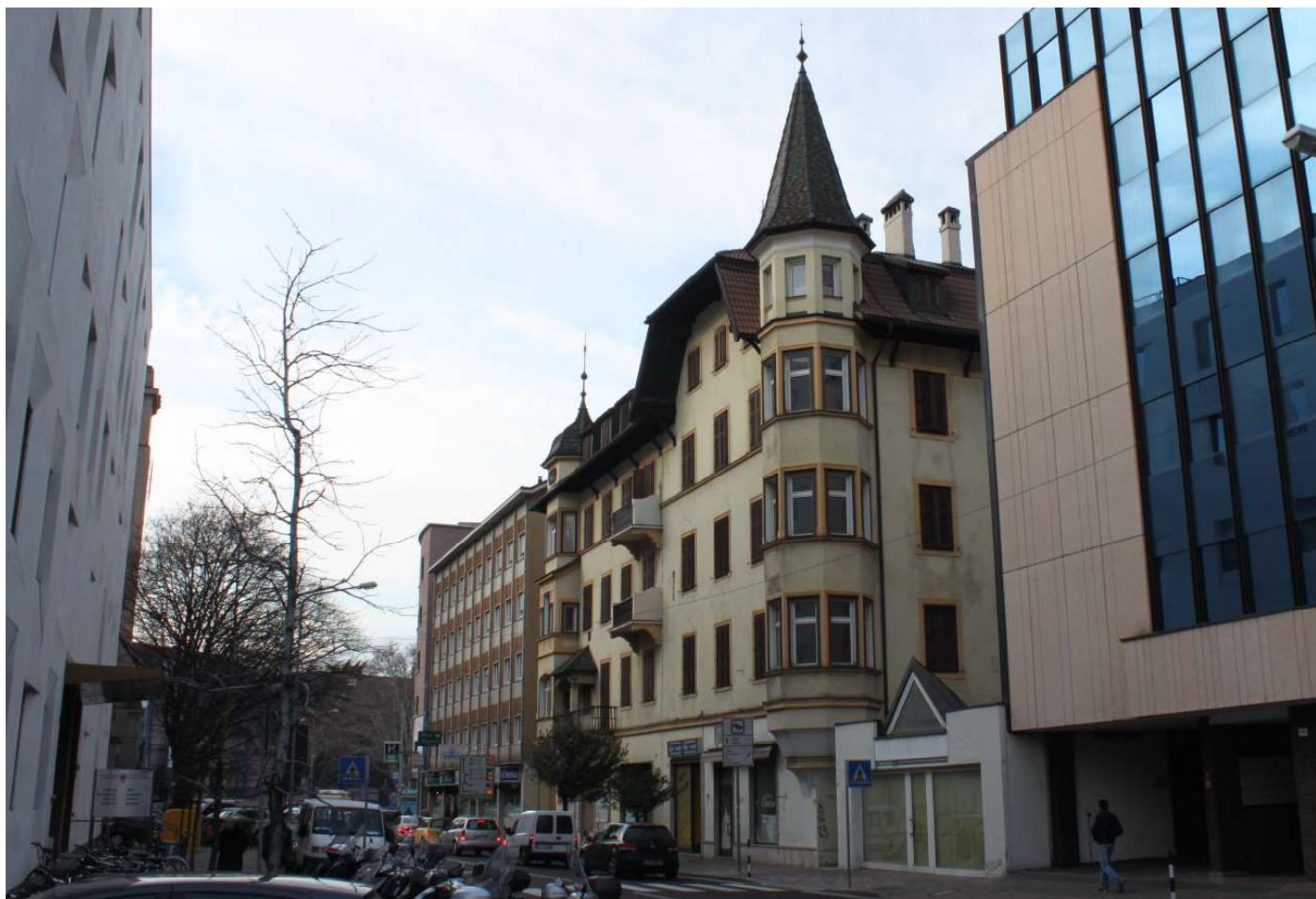
2- Blick von der Rittner Strasse auf die zum Abbruch bestimmten Gebäude - Vista da Via Renon degli edifici oggetto di demolizione