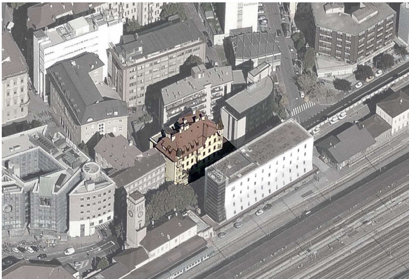
Luftaufnahme Projektgelände - Vista aerea area di progetto