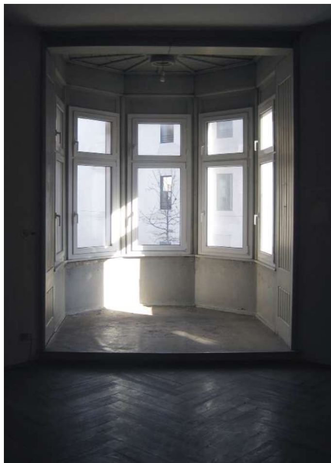
8 - Blick auf das Erkerfenster im Innern des Gebäudes- Vista interna, bow window