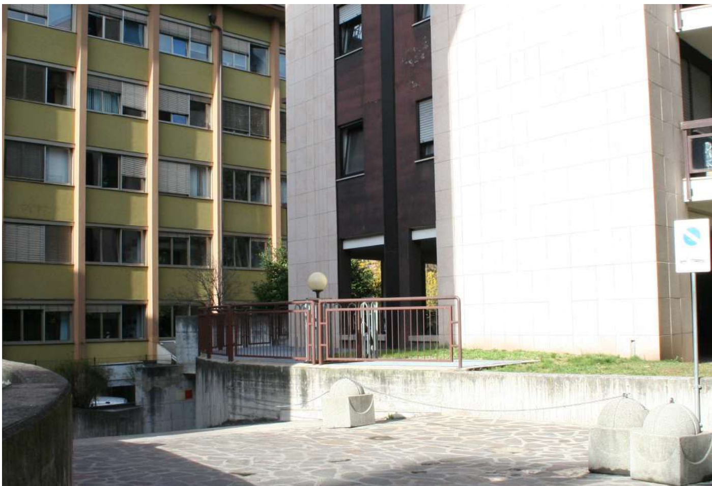
6 - Blick auf den Innenhof - Vista cortile interno