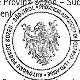
Dr. Luis Durnwalder

Autonome Provinz Bozen – Südtirol Der Präsident